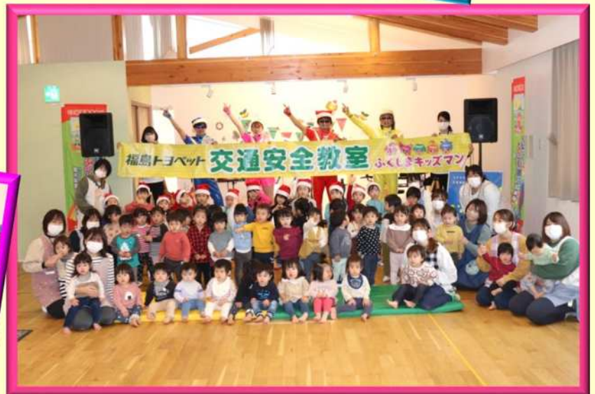
【地域貢献活動(交通安全教室)】